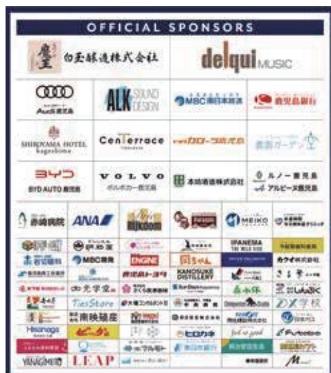
① スポンサーボード A W1800 × H2100