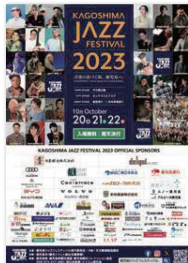
② ポスター A2 W42cm × H59.4cm