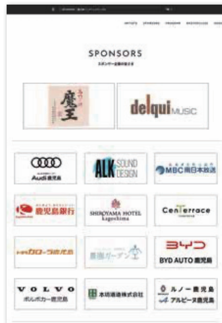
④ オフィシャルホームページスポンサー欄