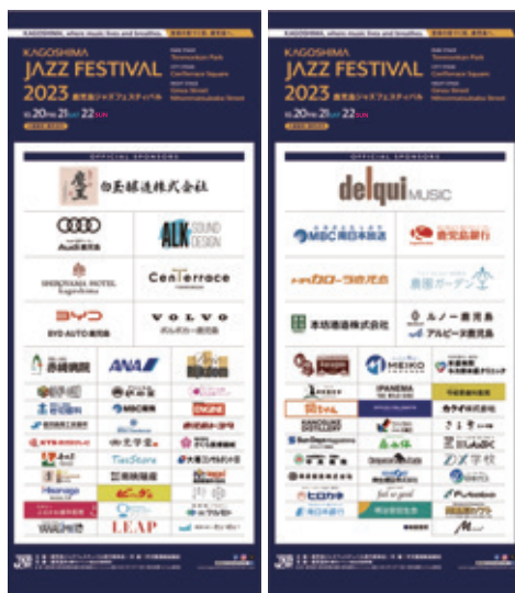
① スポンサーボード B W900 × H2100