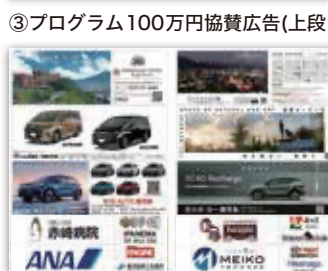
③ プログラム100万円協賛広告(上段) ③ プログラム50~10万円協賛広告