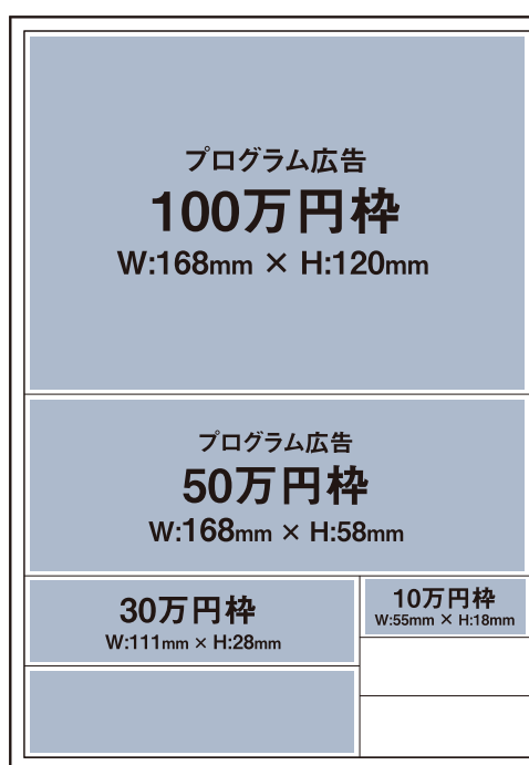
③ 2024年プログラム協賛広告(B5仕上げ)