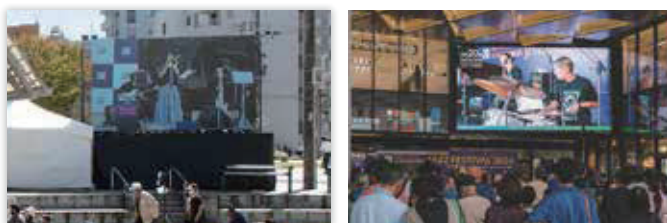
⑥ 天文館公園およびセンテラススクエア大型ビジョン広告ムービー