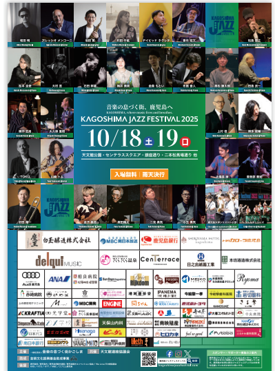
② ポスター A2 W42cm × H59.4cm