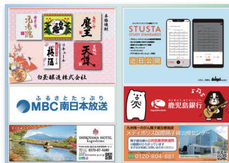
③ プログラム100万円協賛広告(上段)