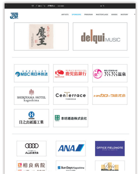
④ オフィシャルホームページスポンサー欄