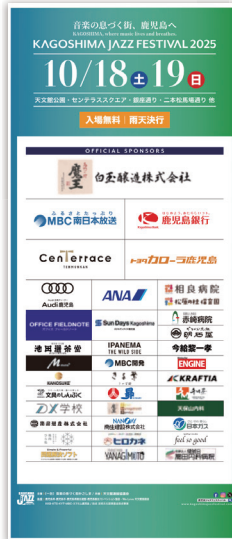
① スポンサーボード B W900 × H2100