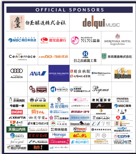
① スポンサーボード A W1800 × H2100