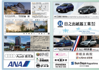
③ プログラム50~10万円協賛広告